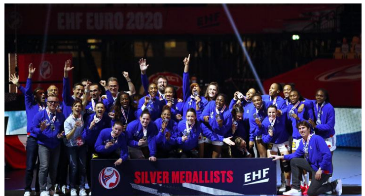
Vice-championnes d'Europe 2020