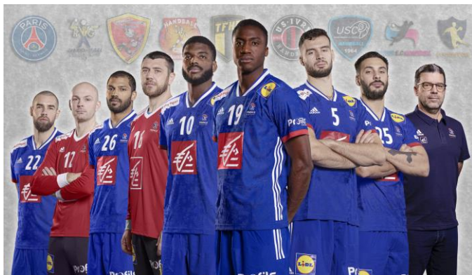
Dans le dernier carré du championnat du monde 2021